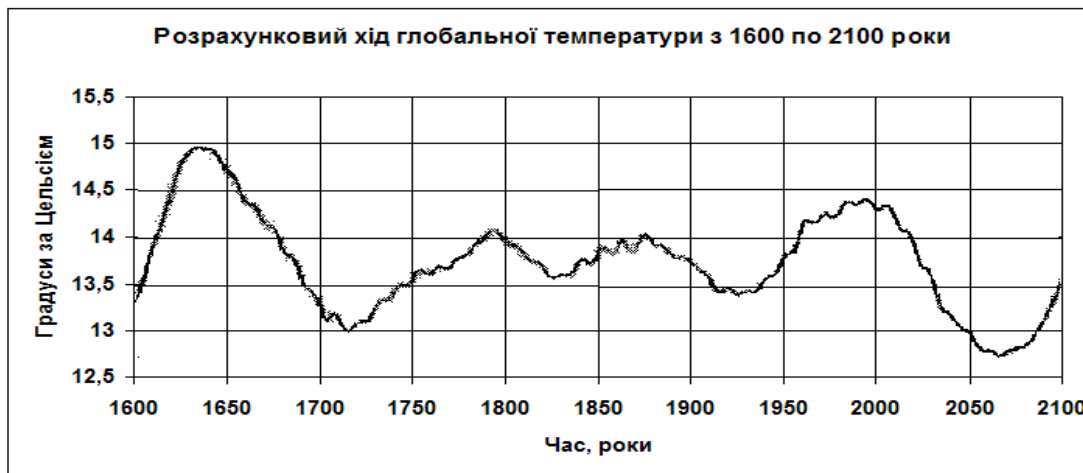
Рис. 2. Тимчасовий хід середньорічної глобальної температури приземного шару Землі за період з 1600 по 2100 рр.

Отже, згідно прогнозів названих вчених, людство чекає до 2070 року не «глобальне потепління», а черговий період малого обледеніння (рис. 2).